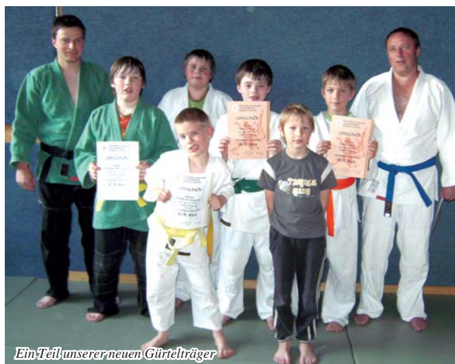
Ein Teil unserer neuen Gürtelträger

Alle Teilnehmer haben bestanden. Das Betreuersteam gratuliert den neuen Kyu-Trägern.