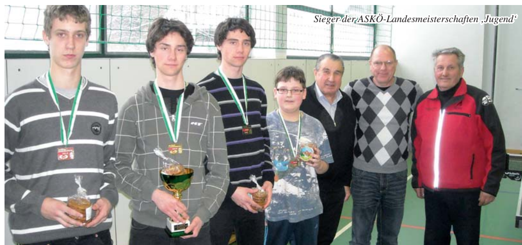
Sieger der ASKÖ-Landesmeisterschaften „Jugend“