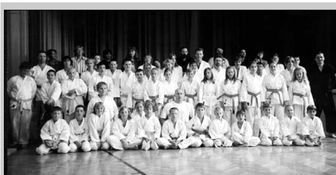
Trainingsbeginn ist wieder am Freitag, den 17. September 2004

17.00-18.00 VS-Knoppen / Kinder / Anfänger 18.00-19.30 VS-Knoppen / Kumite