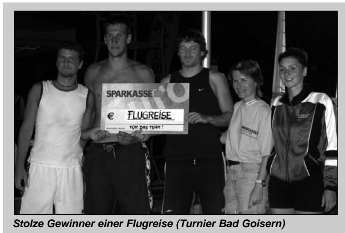
Stolze Gewinner einer Flugreise (Turnier Bad Goisern)