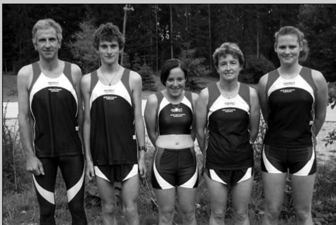
Erfolgreiche Mitglieder der Sektion Lauf-Treff mit den neuen Dressen