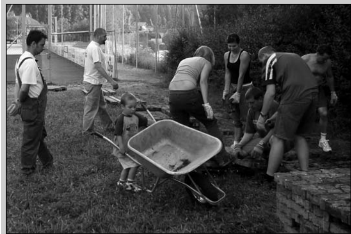
Drunter und drüber - aber keinesfalls ohne Plan und Ziel