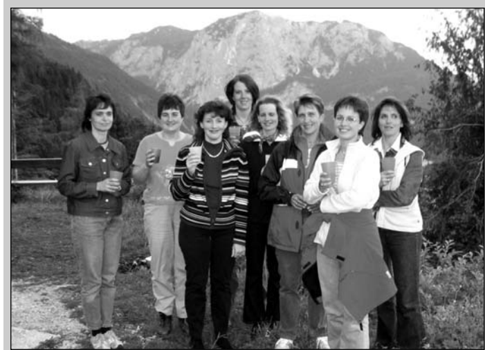
Gemeinsamer Ausflug der Power-Frauen