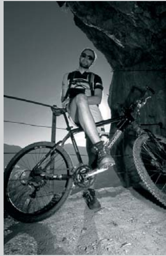
Aufi mit dir! Aufi am Berg!