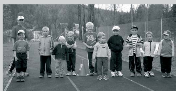
Mini-Kids-Athletics: Spaß haben u. bewegen in frischer Luft!

Seit 19. April findet jeden Montag von 16.30 - 17.30 Uhr im Sportzentrum Bad Aussee spielerisches und kindgerechtes laufen, springen und werfen in vielen Variationen für 4 bis 6-jährige statt. Dieser Kurs wird bis 28. Juni angeboten und wir freuen uns über eure Teilnahme.