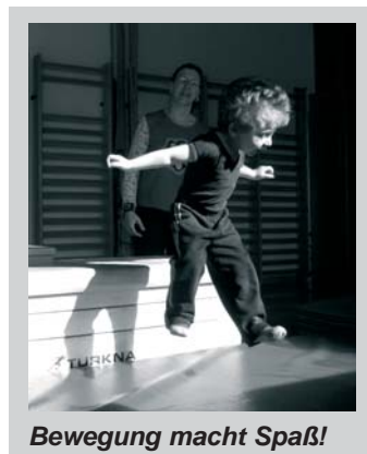
Bewegung macht Spaß!